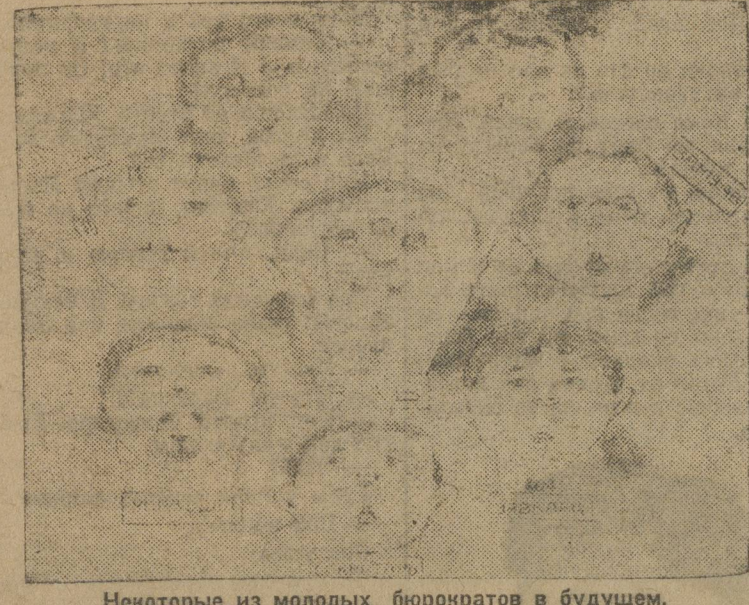
Некоторые из молодых бюрократов в будущем.