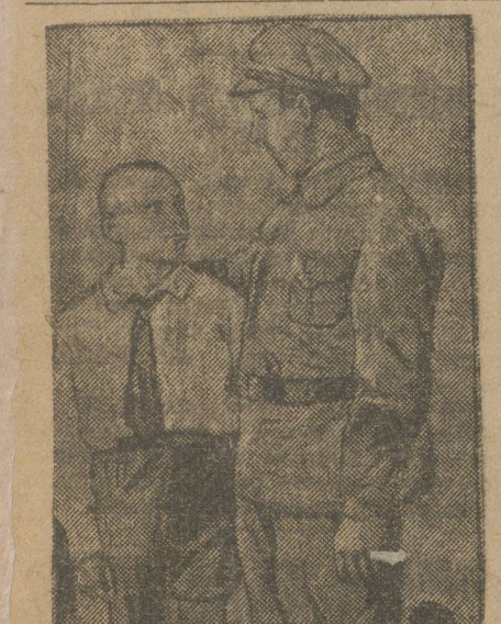
В Харькове закончился V конгресс Красного Спортинтерна, постановивший организовать в феврале 1930 г. международный зимний праздник Красного спортинтерна. На снимке—деятель конгресса...