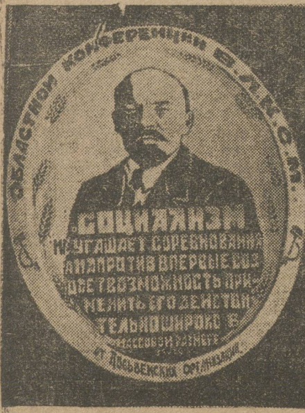
Подарок молодых рабочих Лысьвенского завода: художественно разграванное блюдо.

16 июня областравотдел открывает в Троицком округе областную детскую туберкулезную санаторную колонию. За три летних месяца через колонию предполагается пролечить 360 человек. Ме-