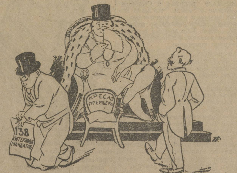
БОЛДУИН (Макдональду): «Кто ж ей милей из нас, друзья... Сегодня ты, а завтра я».

Английское консервативное правительство уходит в отставку. Формирование нового кабинета министров будет поручено Макдональду