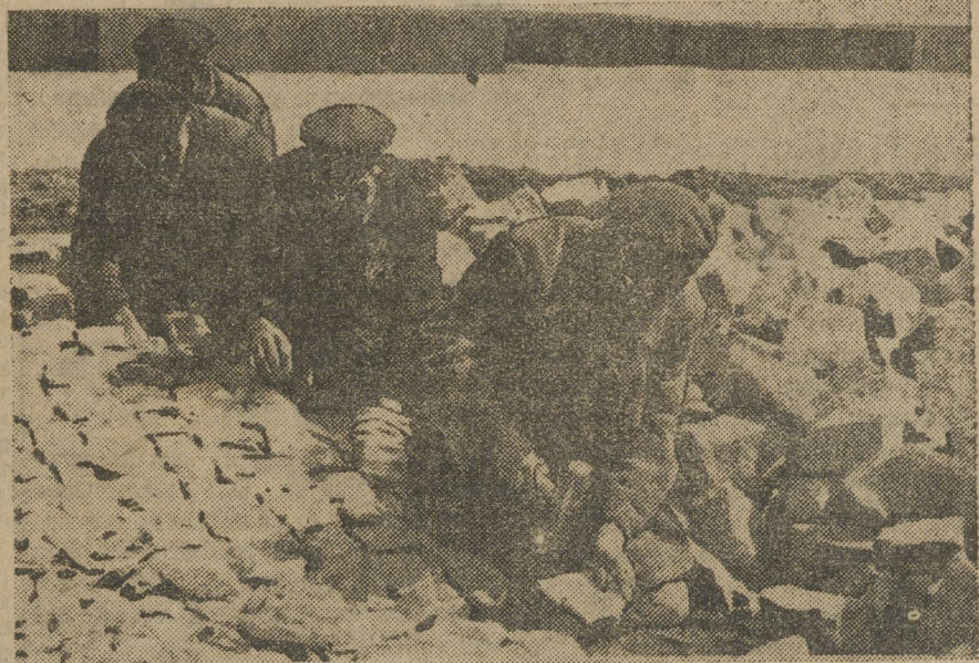
Свердловск одевается. Новая мостовая у Управления Магнитостроя. (Товарная биржа).