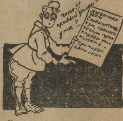
Неустойчивая часть колеблется в сложном переплете классовых борьбы и иногда тоже перекидывается в кулацкий лагерь.