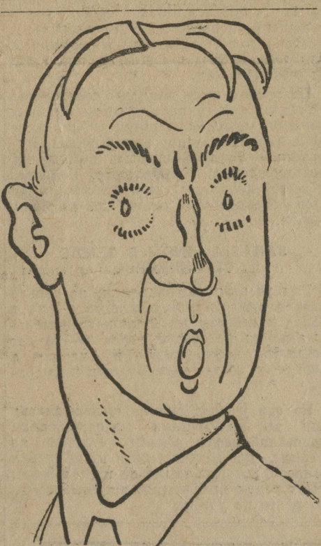
— А что такое комсомол?