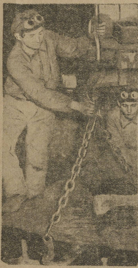
Ударники в литейном цехе. (Надежинский завод).

Для премирования лучших выделены 4 премии общей стоимостью 134 рубля.