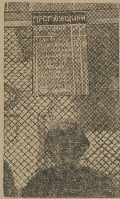
Черная доска прогульщиков в Кыштымской школе ФЗУ.