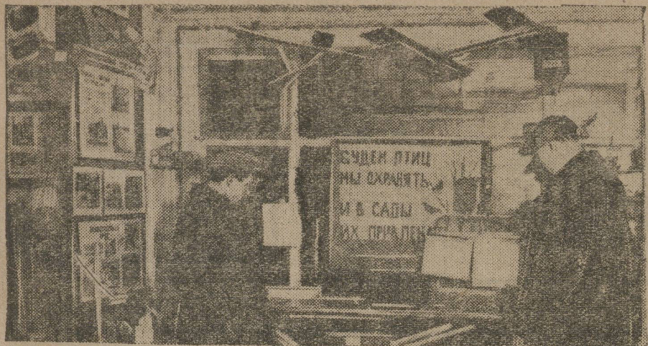
В Москве недавно открыт музей по народному образованию. На снимке: уголок естествознания в дошкольном отделе.