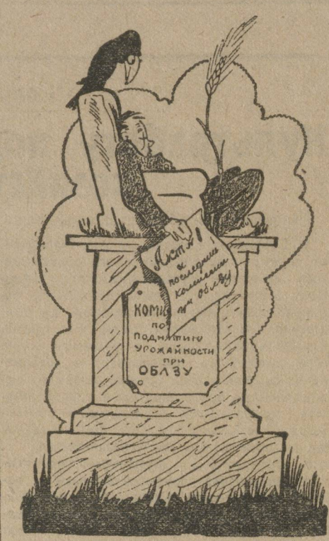
— Я памятник себе воздвиг нерукотворный...

Вторая секция—агро-техническая—должна была заняться разработкой ме-