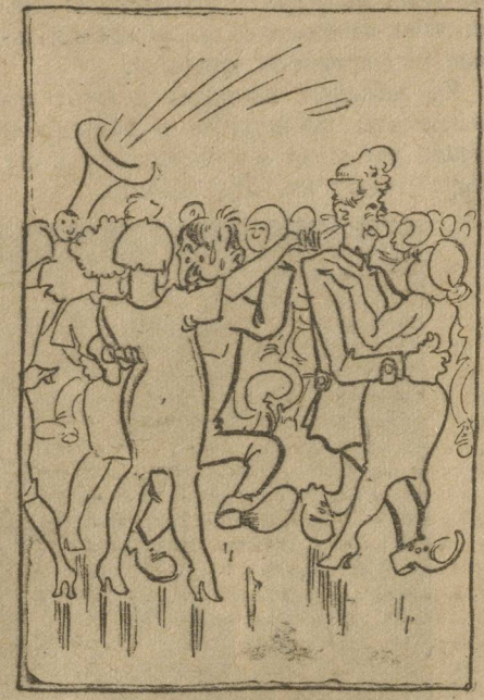
Бал в полном разгаре.

В последние дни она сильно увлеклась каким-то старым романом, в котором благородная героиня-актриса стойко переживает ряд жизненных испытаний.