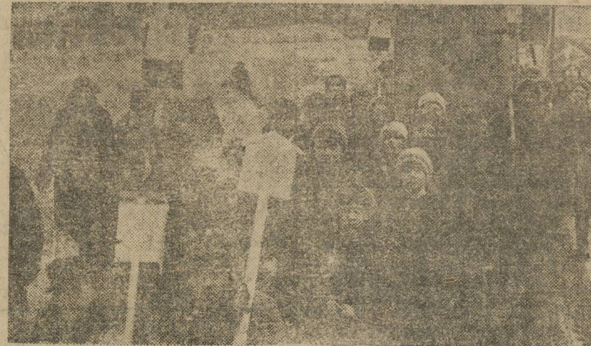
Со скворешнями в сад.

Детвору приветствовали также от имени преподавателей свердловских