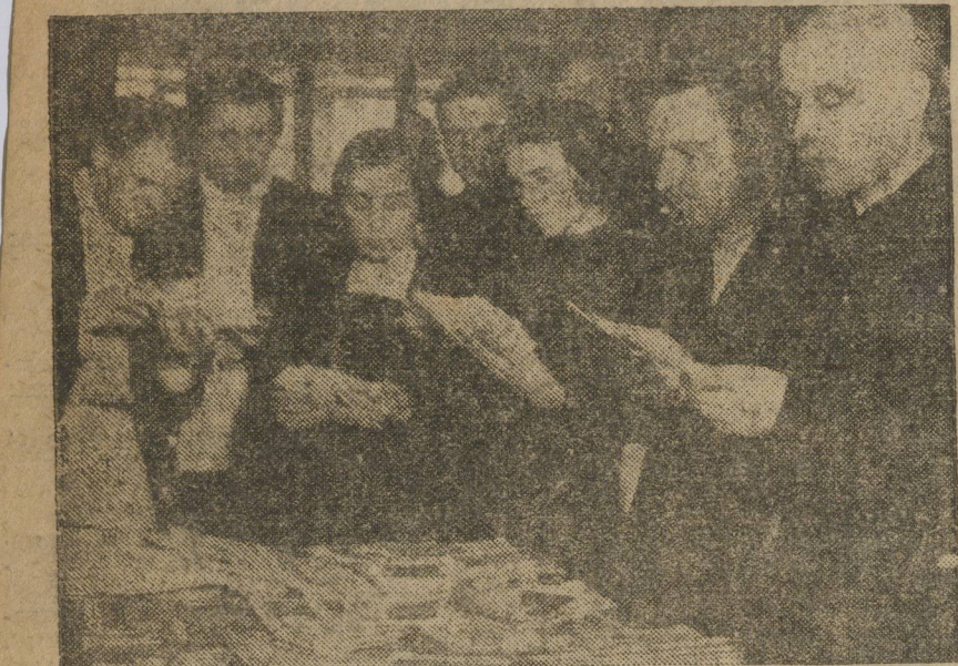
В перерыве у нижнего источника.