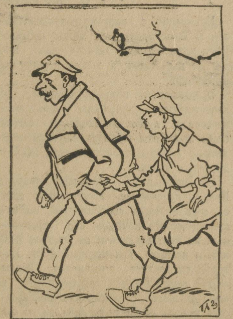
— Дядя, перестариваться? Прикрепленный Угу!—А может подождать? Прикрепленный Угу! (начинает сначала).