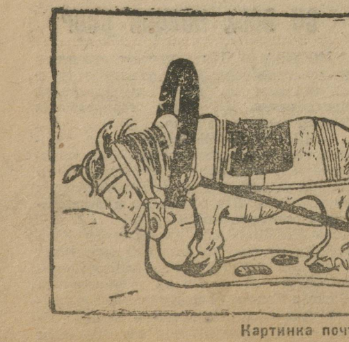
Картинка почти с натуры.