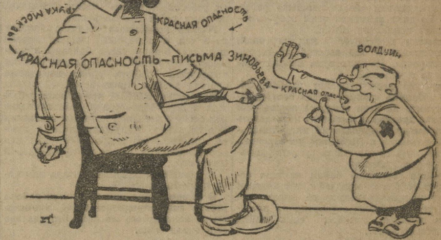
АНГ. РАБОЧИЙ: Ну, а как насчет безработицы!

В связи с предстоящими выборами комсерваторы вынашивали старые лозунги о «красной опасности» и т. п. (Из газет).