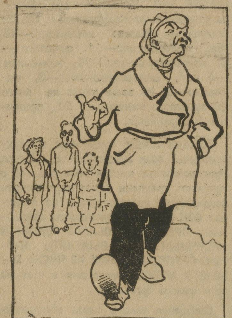
Прикрепленный: «как ими руководить, когда они беспартийные».

люди политически неграмотные. Ведь у тов. Коротавина выходит, что комсомол организация бесклассовая, не имеющая своего политического лица, ведь вот до