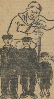
Научайте рабочую молодежь!