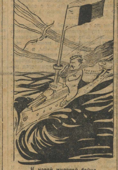
... К новой мировой войне.

Смета французского военного и морского министерства увеличена на 600 млн. франков.