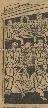
Литературный хлам на библиотечных полках.