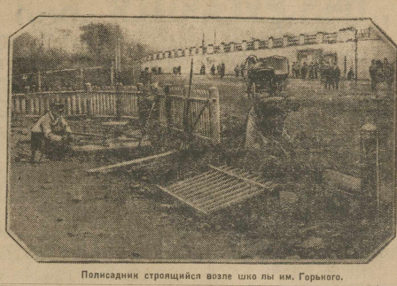
Последний строящийся возле школы им. Горького.

20 сентября в 10 час. утра состоится совещание секретариат районного комитета. О речи организации. Информацию районное о ходе подлинки на 3-й яван индустриализации. На пленум вызываются агитаторы районного комитета. БЮРО ОКРУЖНОГО ВЛКСМ.