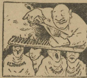
Одна гребенка для всех.

Когда на ВИЗ'е началось социалистическое соревнование, то перед заводской ячейкой крупяносортового цеха всталась большая задача выжить действительного агитатора за соревнование среди беспартийной молодежи и взрослых рабочих. Но ячейка с этой задачей не справилась. Массовая работа ее была сплошной сабой.