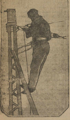
Строим уральев. Подоска провадов.

Новые автобусы в ближайшие дни будут пущены на линию.