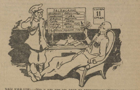
ЧАН КИ-ШИ:—«Что у нас там сегодня по расписанию: обстрел или миролюбивая нота».