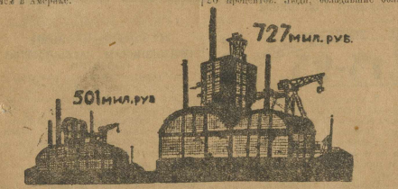
501 МИЛ. РУБ. 727 МИЛ. РУБ.

Не отступая ни на шаг от великой партии Ленина на быструю индустриализацию страны, на решительные и значительные антикапиталистические действия, на усиленное наступление на кулачество, в частности помощь массовому кооперированию и коллективизации бедняцко-средняцких хозяйств, — мы выполним и выдвинем пятилетний план социалистического хозяйства по-ленински.