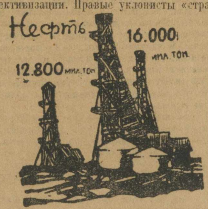
12.800 тонн, 16.000 тонн

Только за первые три месяца текущего хозяйственного года мы успели в ход ноября десяти новых домовных печей, новых жаропрочных печей и т. д. В первое полугодие начали работу 50 новых фабрик, заводов и шахт. Такой план продукции нашей промышленности был намечен в размере около 21 проц. а