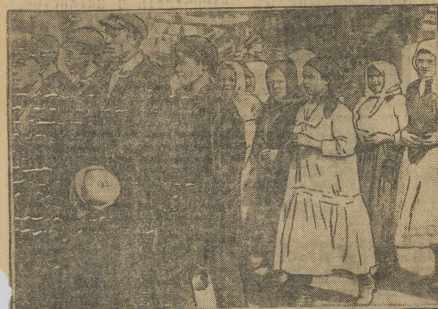
На демонстрации 1 сентября.