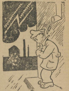
«Профсоюзник!»—Сперо ли кончится?

Социалистическое соревнование разворачивается по Указу Советского Союза не является кампаней. Но очевидно не так думают некоторые руководители организаций в Кунгурском округе. Их представление о социалистическом соревновании как о кампаниях заглушило инициативу соревнованию.