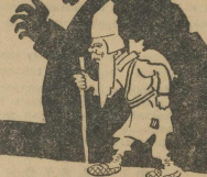
Б. кулак памятникат.

Основной упор в антирелигиозной работе надо на православные, тогда как борьба с сектантами требует уже осознания полнейшей заблужденности секты незначительно по количеству приверженцев, принимают чрезвычайно большой вред, в частности, большого внимания заслуживает секта «Странников», которая свела себе противные газета в деревнях Старо-Уткинского района (Свердловск. окр.). Основной упор в антирелигиозной работе надо на православные, тогда как борьба с сектантами требует уже осознания полнейшей заблужденности секты незначительно по количеству приверженцев, принимают чрезвычайно большой вред, в частности, большого внимания заслуживает секта «Странников», которая свела себе противные газета в деревнях Старо-Уткинского района (Свердловск. окр.).