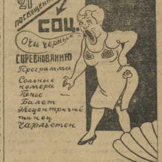
Международное революционное соревнование

Сейчас клубом закуплена кино-плоская для съемки картины «Соревнование на построениях Свердловска». Эта съемка затем будет включена в особую живагазетный монтаж. А. С.