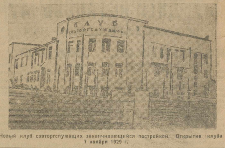
Новый клуб советского спорта закончен постройкой. Открытие клуба 7 ноября 1929 г.