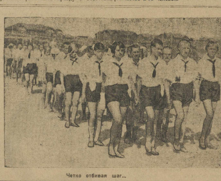
Четко отбивая шаг...

класса неизбежно превращаются в политическую борьбу против всей капиталистической системы.