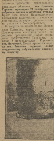
Паряд пожарники 11 августа. На снимках показательно тушение горящей фабрики и передача знамен.

Со вчерашнего дня в Свердловске началась противопожарная неделя. В эти недели будет усилена борьба с пожарами со всеми нарушениями противопожарного порядка.