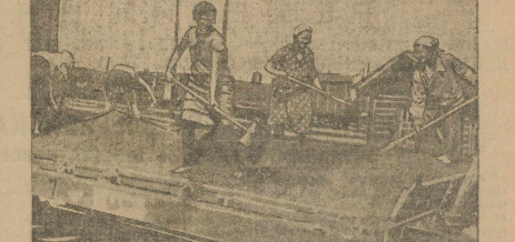
Воскресенье, 11 августа, служащие свердловских учреждений обрабатывают суббитум в бочах индустриализации. На снимке разгрузка песка на суббитумные станции Правления П. ж. д. В суббитум не участвовало 500 сотрудников

В 1929-30 году устанавливается четыре новых рафана в Златоусте, Тагиле, Лысье и Чусовой. Груша промышленных рабочих в этих рафанах будет доведена до 85 проц. всего состава.