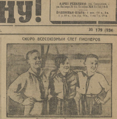
Приехали гости из Германии.