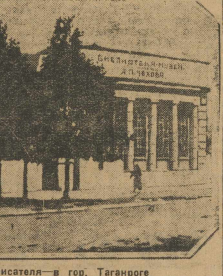
Библиотека им. Чехова, на родине писателя — в г.д. Таганроге.