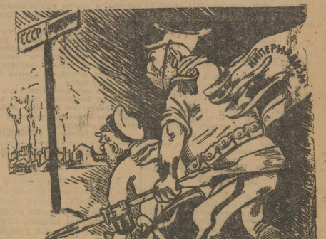
РУКА, КОТОРАЯ НАПРАВЛЯЕТ.

Многие молодые рабочие и крестьяне знают, что это — на Китайско-Восточной железной дороге, почему она принадлежит нам, как и китайцам, почему на ней совершился захват и т. д. А между тем, очень мало народа знает, что это такое. Тогда попытались объяснить простыми словами.