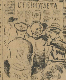
Перед обедом во дворе вывесили стенную газету.

В понятия Гераиска еврей был далеко не похож на русское. Высок лобной независимо от пола и возраста он делал на русских евреев, похвывая чужой родом парижской. Еврейство латино он считал самой последней и чужающейся оней почему-то непероборозательна и даже враждебно. Чувствуя эту раздраженность, он боялся ее высказать. Сенная ненависть не затихала, и на душе не становилось легче.