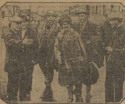
Встреча делегации норвежских горняков на вокзале.

Сегодня молодежь 1 района после прогулки в садах вечером посетит ряд десяткой годовщины освобождения Урала от Колчака, направляется в 1 часу ночи на вокзал—Свердловск 1—туда и встречают во встречем. В районном ВЛКСМ решил собрать комсомольцев и 9 часов вечера в помещении района, откуда все организованном порядке поедут гулять в сады, а затем на вокзал. Ячейки должны проявить большую инициативу в деле подготовки и встречи. Нежелательно заготовить планы, флажки и т.д.