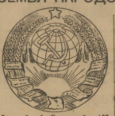
Советский герб, объединяющий по 100 национальностей, населяющих СССР.

Первый съезд советов СССР состоялся в 1922 году. Четире советские республики—РСФСР, Украинская, Закавказская, и Белорусская—образовали Совет СССР. Декларация 1-го Съезда Советов СССР, составлявшая первую часть нашей Великой Конституции, гласит, что оставшаяся наследием от войны, которая разрушила хозяйство всей страны, «делает недостаточными отдельные усилия отдельных республик по хозяйственному строительству»... «неустойчивость международного положения и опасность новых нападений, делают неизбежным создание единого фронта советских республик перед лицом империалистического мира. Наконец, самое строение совет-