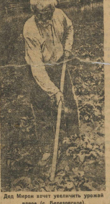
Дед Мирон хочет увеличить урожай ячменя (с. Березовское).