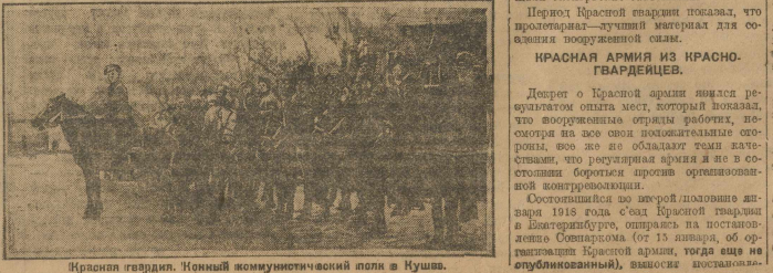
Красная гвардия. Конный коммунотничий полк в Кушвах.