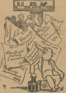
...а об очередях забыли.

Свердловский Церабкоп статистика вступили в соревнование 3 недели назад. Этот времен достаточен для того, чтобы начать работу. Но на всем предприятием не сделано почти ничего, чтобы начать по настоящему соревнование. Торжественные договоры и декларации написаны, вывешены брешны, а за всей этой парадностью работ нет. Кое-что сделано лишь в комсомольском магазине. Там в соревновании участвуют и комсомольцы предприятия привели почти на полтора процента больше товаров, при этом обязательство сохранили на листе ре-