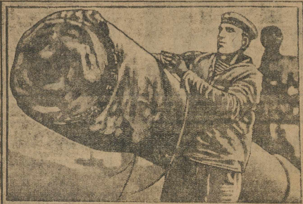
Ленинград. Балфлот вышел в большой морской поход, который проходит под флагом социалистического соревнования.