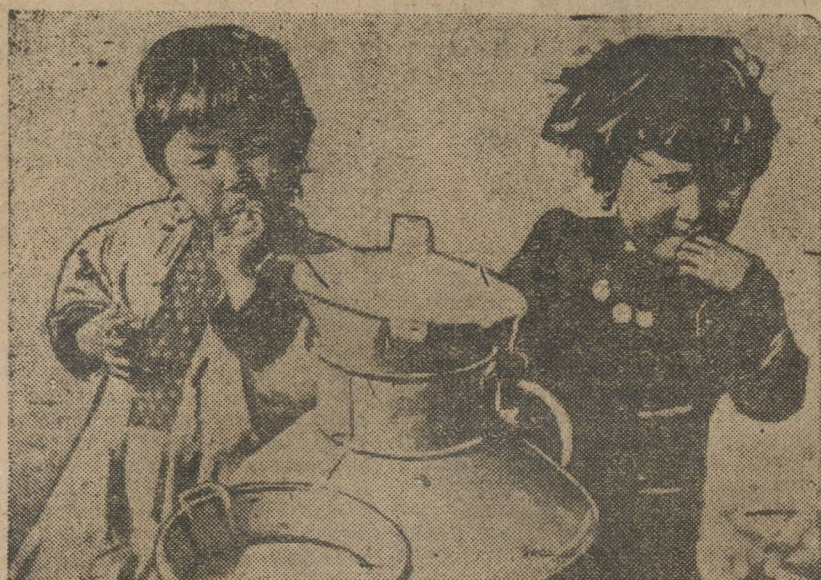
Киргизские дети у бидонов с кумысом. (Троицк. окр.)

из принадлежностей к партии пытаются извлечь материальную выгоду — шкурники и карьеристы.