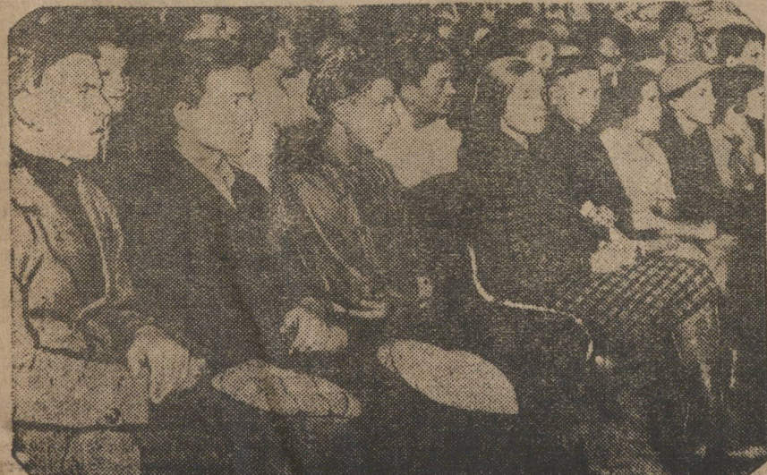
Доклад захватил внимание аудитории.

10) Поручить Окружному ВЛКСМ вместе с газетой «На Смену» через три месяца проверить выполнение этих решений и результаты опубликовать в газете.