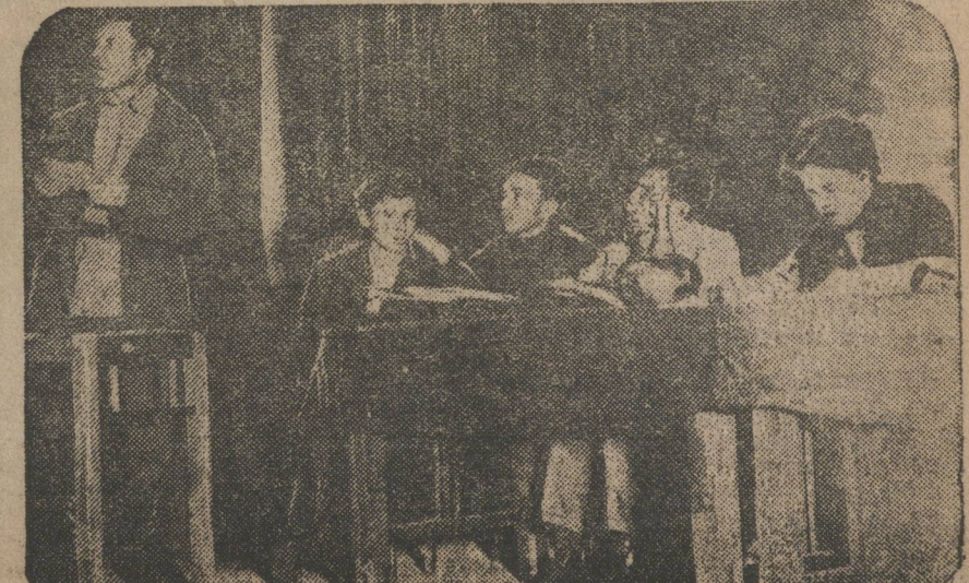
Комсомольцы горячо выступили в прениях