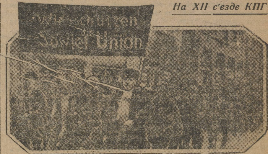
Демонстранты выходят из дома имени Карла Либкнехта. Плакат с надписью: «Мы защищаем Советский Союз».

ШАНХАЙ. В южной и западной частях провинции Цзянси усилилась деятельность повстанческих отрядов руководимых коммунистами. Телеграфное сообщение с целым рядом районов прервано.