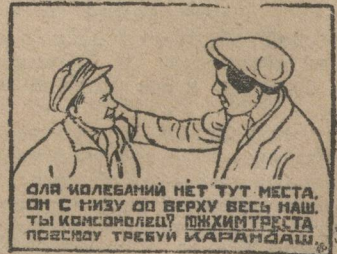
Для колебаний нет тут места. Он с низу до верху весь наш. Ты комсомолец? Живит ли? Поезжай! Требуи кабардан!

Врид. ответственного редактора И. ШИФМАН.