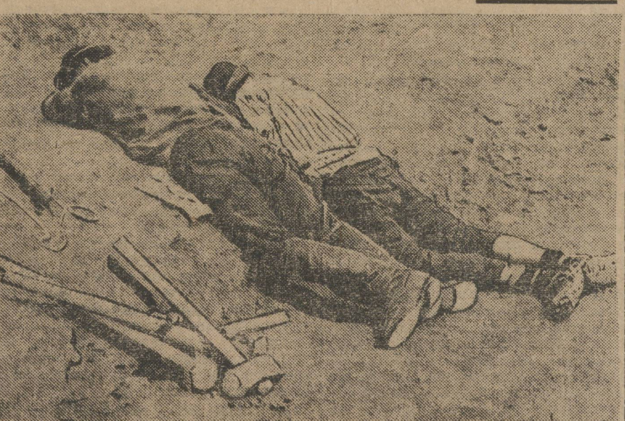
Они прилегли на работе отдохнуть. Есть у нас такие «горе-строители».