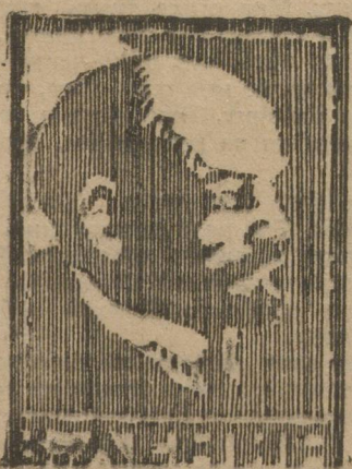
ПОРТРЕТ ЛЕНИНА, ПЕРЕДАННЫЙ ПО РАДИО.

— В Москве сейчас голод, а у нас много хлеба. А Ленин большой человек. Мы должны ему послать много хлеба на его праздник.