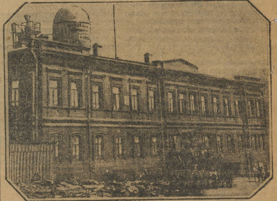
Златоустовская школа II ступени с 1925 года имеет свою обсерваторию.