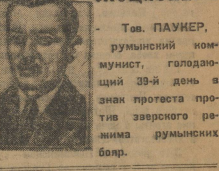
На темы дня