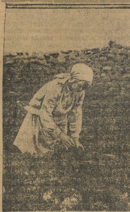
Молодая работница на торфяных разрабатках.

КУНГУР. (Соб. корр.). Рабочие сарапульских кожевенных заводов прислали кунгурским рабочим-кожевникам открытое письмо, которое было зачитано на предпринятых и для более широкого распространения напечатано в местной прессе. Рассказав о своем дружном выступлении на фронте социалистического соревнования, сарапульские товарищи переходят к цифрам, доказывающим их достижения. Они пишут: «Несмотря на разрозненность производства, что создает непоследовательность процессов труда и что обнимает много труда для перетаски и перевозки, мы за 6 месяцев работы 1928-29 г. довели следующие результаты: стеномостовья с 230 р. 13 к. довели до 222 р., стоимость посаженных изделий с 477 р. до 422. Себестоимость продукции снижена на 12,18 проц., прокулы сообра-