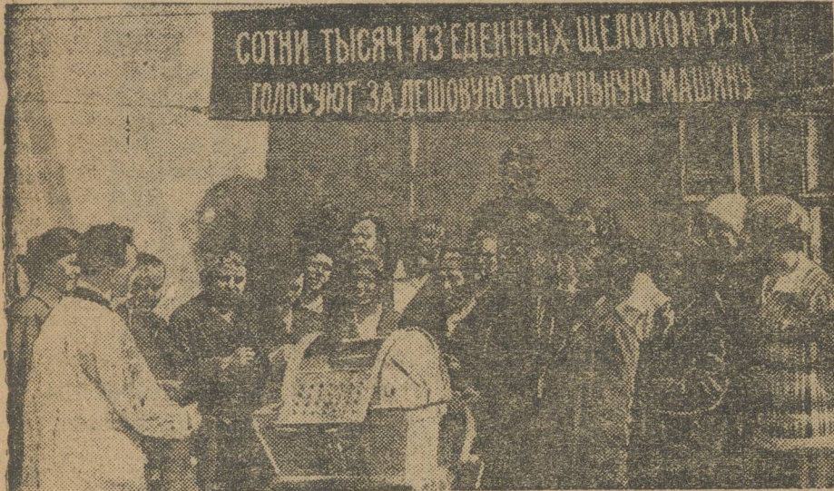
Массу времени, энергии и сил женщины убивают на стирку белья. Теперь вводится новая машина, полученная из Германии, которая в течение 2-х часов стирает 75 штук белья. На снимке — женщины, председатели сельсоветов Московской области осматривают стиральную машину.

СОТНИ ТЫСЯЧ ИЗ ЕДЕННЫХ ШЕЛОКОМ РУК ГОЛОСУЮТ ЗА ДЕШЕВУЮ СТИРАЛЬНУЮ МАШИНУ