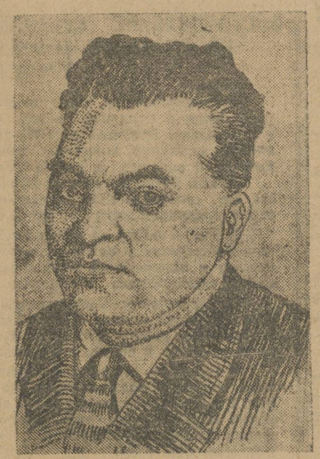
Шахматный мир понес тяжелую утрату. 6-го июня в Праге умер от скарлатины в возрасте всего 40 лет гроссмейстер Рихард Рети.

Рети был одним из крупнейших мастеров современности, одним из создателей и вождей ультра-совершенной (новейшей) шахматной школы—гипермодернизма. Рети создал переворот в шахматном искусстве и чрезвычайно обогатил его своими новыми идеями. Его интереснейший дебют—начало Рети—те-