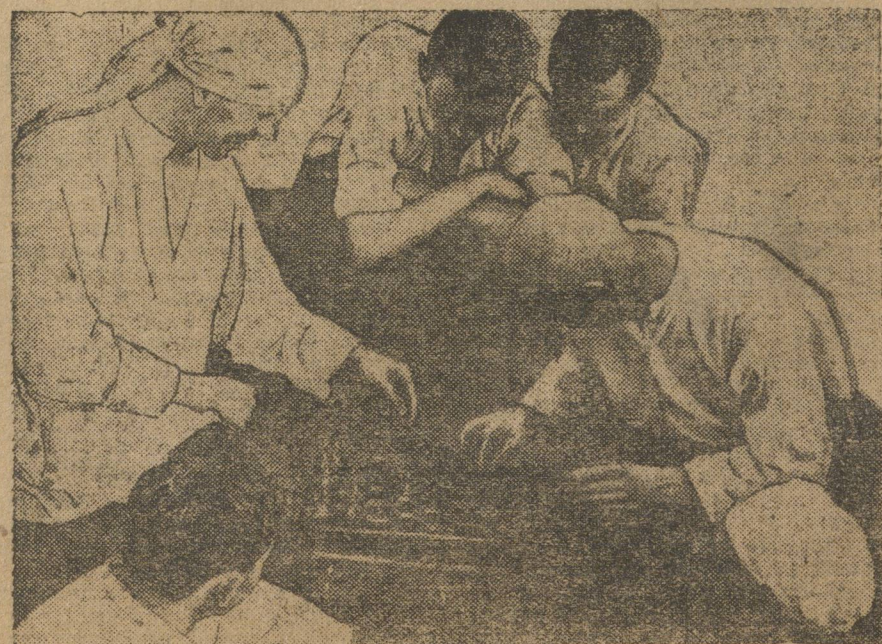
На Троицком нумеро-лечебном и уроте Уралоблтрехависсы.