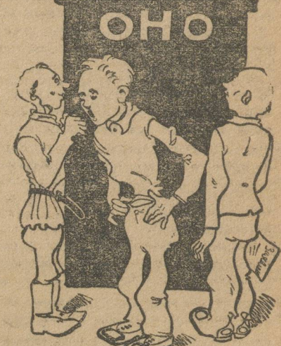
Урна с прахом Камышловского ОНО... «... Сиротливые, обездоленные школьники...»