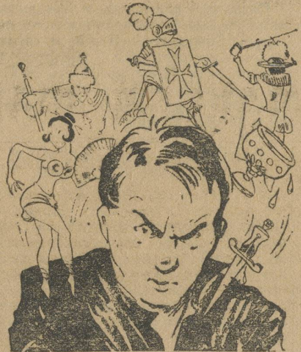
«В волнах сказки...»