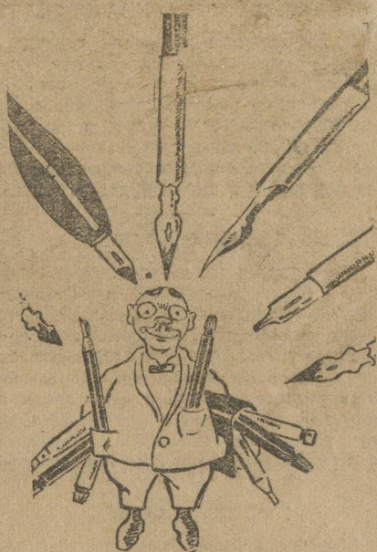
Возьмем в рабкоровские перья.