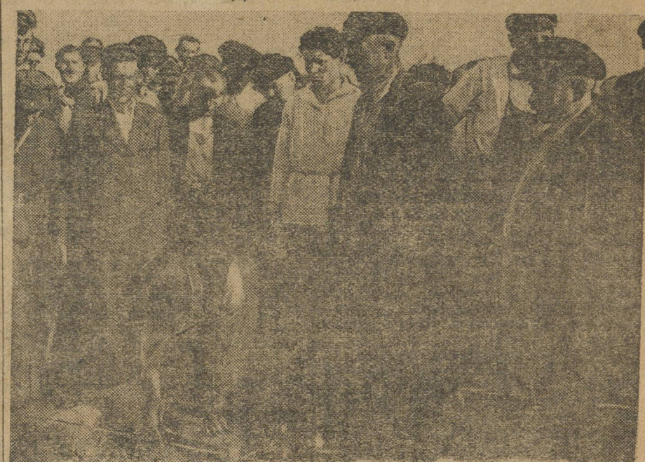
Недавно произведена закладка ст. Карталы (Троицко-Орской дор.). С этой станции пойдет дорога к Магницкому горному строительству.