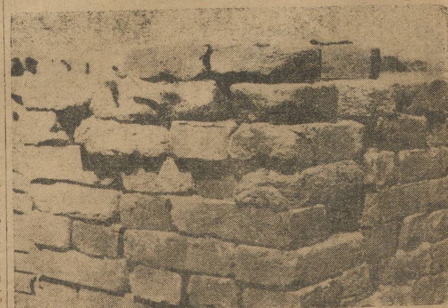
Такие плохие кирпичи Магнитогорскому строительству доставляют местные организации.