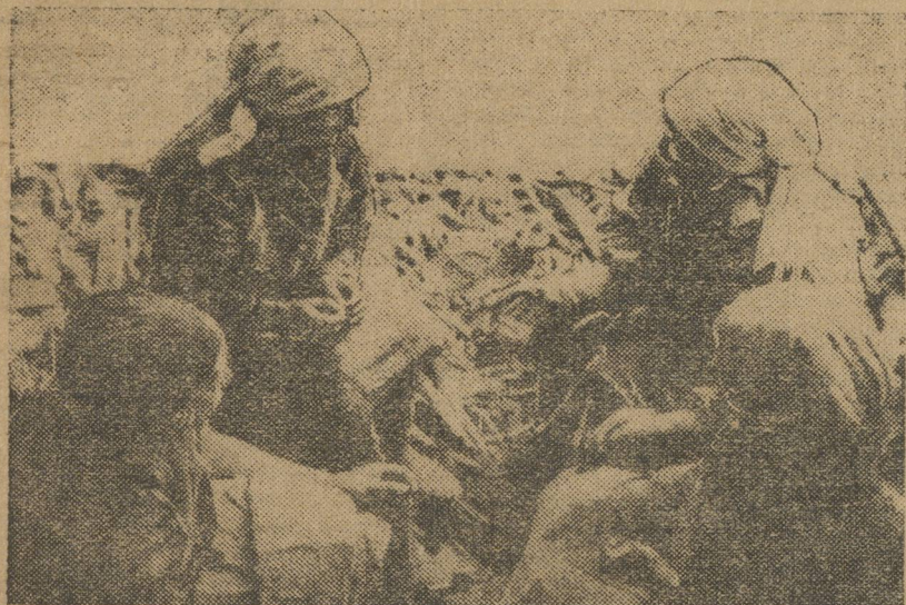
На постройке дома горсовета № 3. Во время работы разговоры завели.