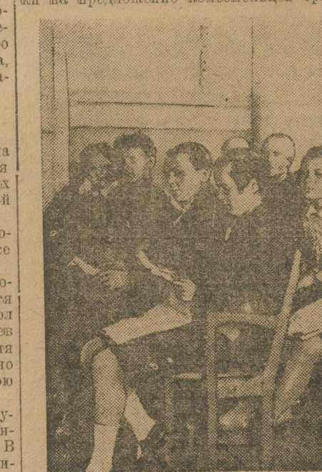
Во время заседания...

В партруководстве над комсомолом недостатков очень много. Иногда дело принимает аполитический характер. Был случай, когда секретарь партиячейки на предложение комсомольцев орга-