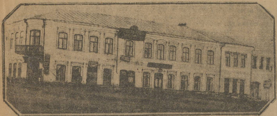
В.-Уральский Дом Крестьянина (Троицкого окр.). Один из лучших районных домов крестьянина.