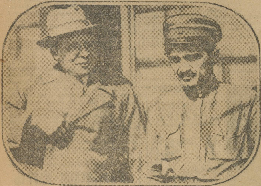
Т. Т. Рудзутак и Микоян выходят из Большого театра после заседания съезда съездов.

28 мая утром — заседания комиссий в фракциях, сеньоренковента. Заключительное заседание съезда состоится вечером 28 мая.