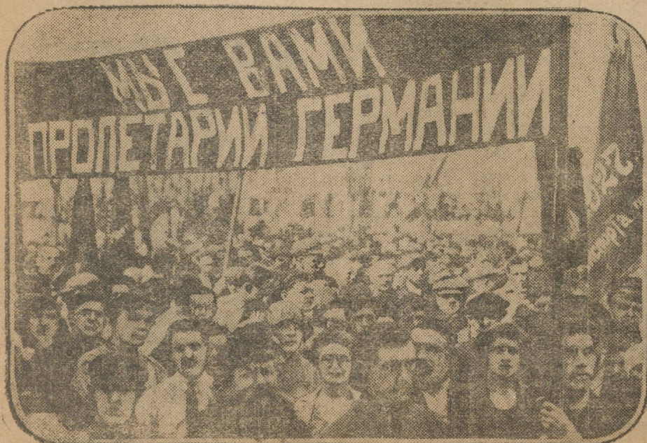
Под таким лозунгом в Вологде состоялась мощная демонстрация рабочих и служащих Вологды. На снимке—колонна демонстрантов.