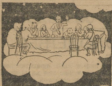
Так представляют себе некоторые комсомолы комиссию по чистке.