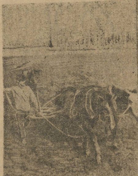
В Челябинском округе начался весенний сев. На снимке:—Проходит первую борозду.