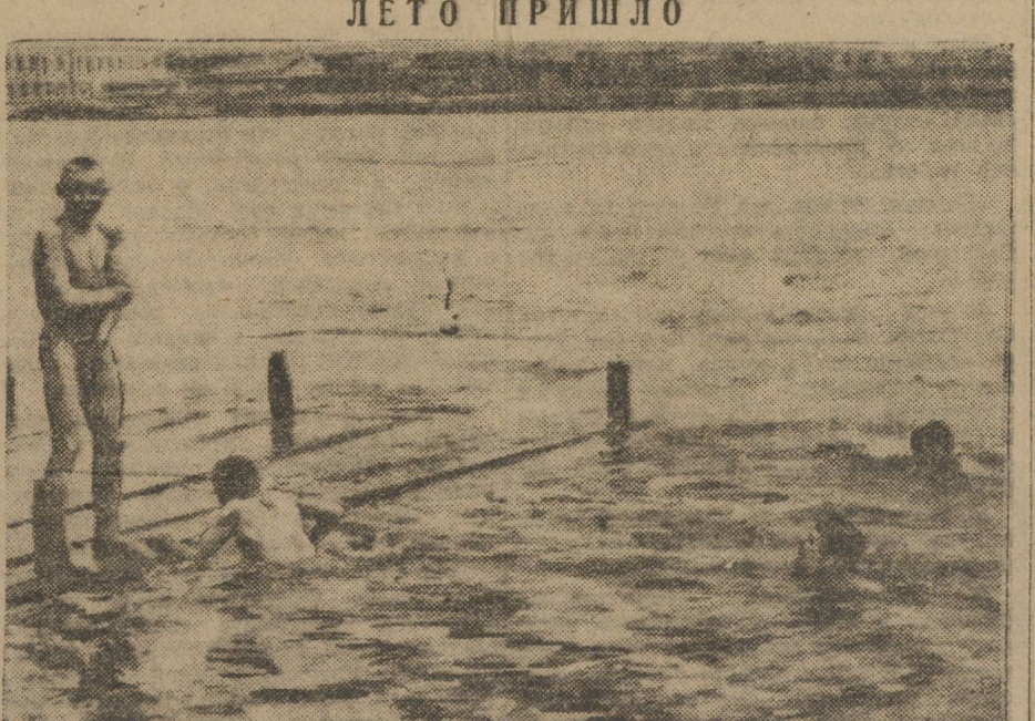
Первые купальщики на свердловском пруду.

ЗДАНИЕ ТЕАТРА ИМ. ЛУНАЧАРСКОГО НУЖДАЕТСЯ В РЕМОНТЕ.