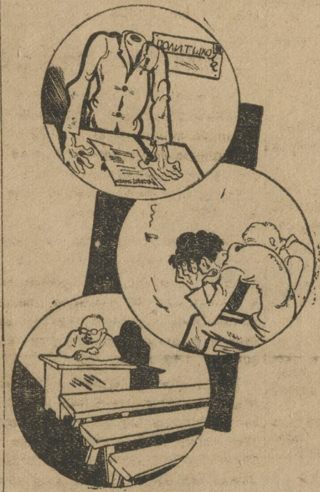
Мартинки политшкольного быта.