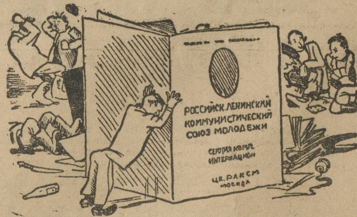
ДО ЧИСТКИ, КАК ЗА КАМЕННОЙ СТЕНОЙ...