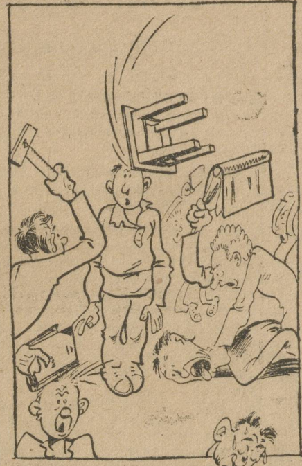
Кружок «прорабатывает» тему.

Увязки прорабатываемых тем с местными и текущими хоз.-политическими кампаниями не было, наглядные по-