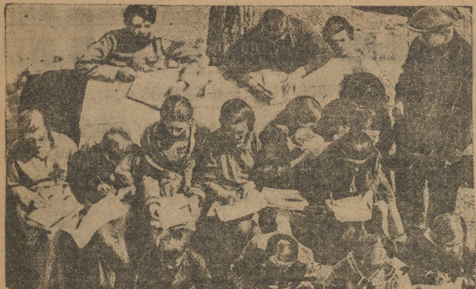
Лето наступило. Свердловские школьники в саду УОСПС рисуют с натуры.