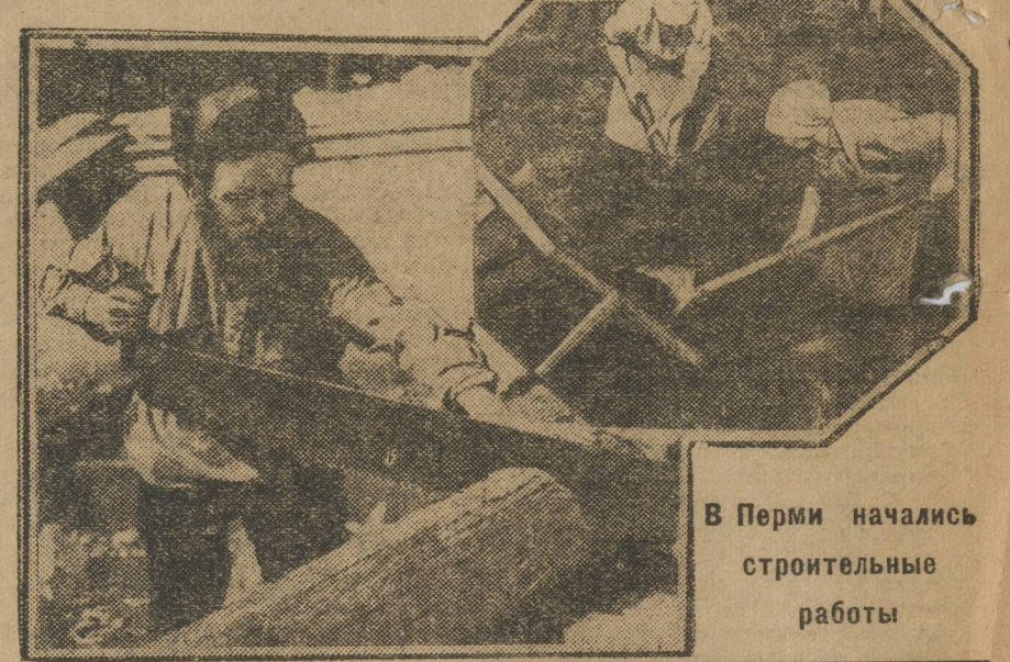
В Перми начались строительные работы