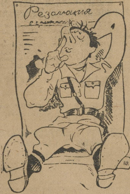
В муках перестройки.

Работой нагружены не все. Работают только «старички», да и как работают-то, больше говорят. У многих