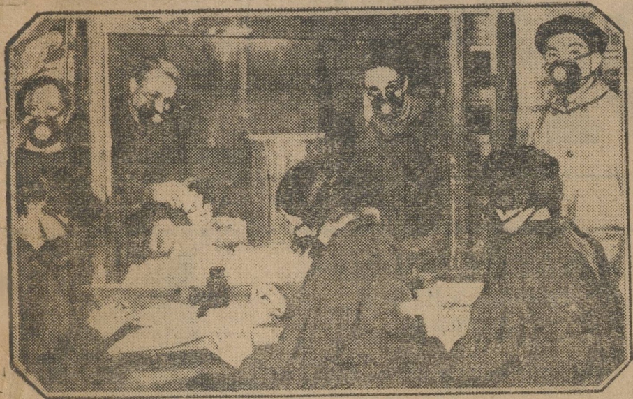
Ленинградская областная станция защиты растений. Рассыпают по пакетам изобретенный в ленинградской станции яд «Мортус».