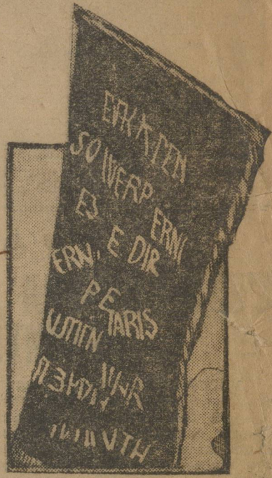
Знамя, подаренное кунгурскими железнодорожниками гамбургским рабочим к 1 мая.

Вместо закрытой германской полицией коммунистической газеты «Роте Фана» германская компартия выпустила подпольную газ. «Роте Штурм-Фана» («Красное боевое знамя»), которая издается в Амстердаме (Голландия).