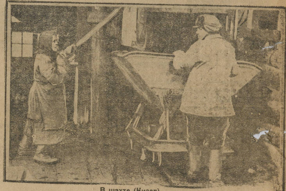
В шахте (Кизел).