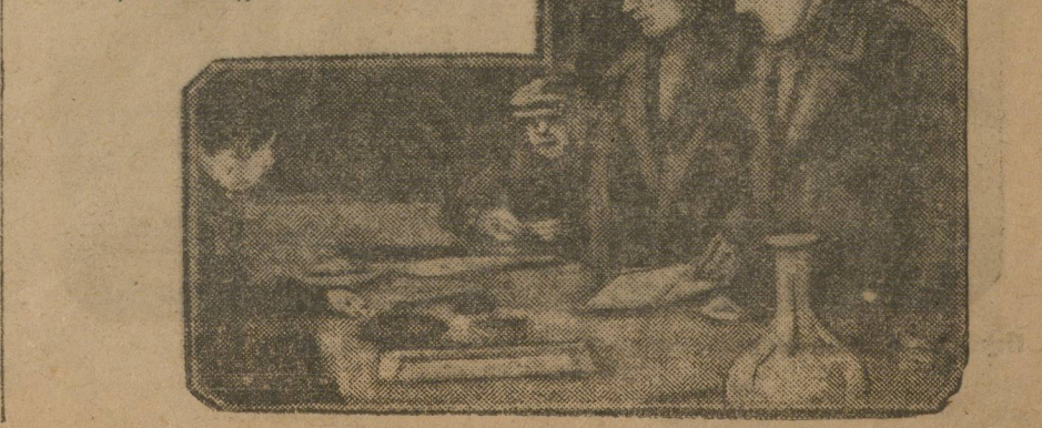
Делегаты партконференции на регистрации в мандатной комиссии.

Наше строительство все время шло и идет в условиях классовой борьбы, на данной стадии принимающей острейшие формы. Пятилетний план является планом большого наступления пролетариата на остатки буржуазных классов города и деревни. Вместе с тем он является планом широкого начала социалистической переделки бедняцко-среднекрестьянских хозяйств путем кооперирования и коллективизации их. Материальные организационные пред-