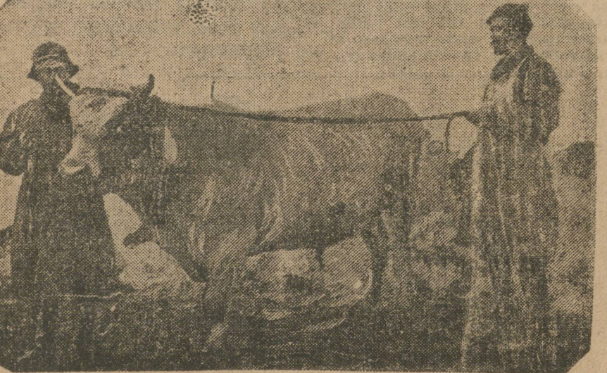
Породистый бык «Плутин» из коммуны «Факел» (Н.-Завиского района, Тюменского округа).