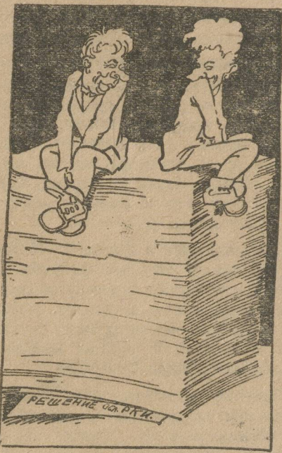
Легит на нем камень тяжелый.

С этой целью коллегия ОблРКК вынесла ряд практических предложений. Объявив выговор председателю обкома