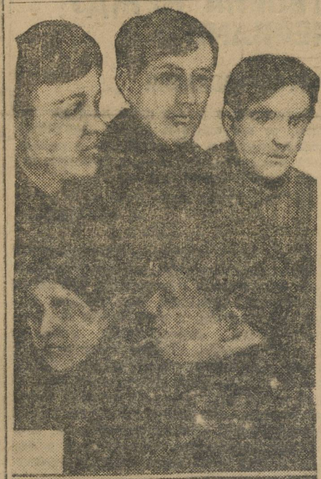
Группа визовских фабзайцев-туристов.