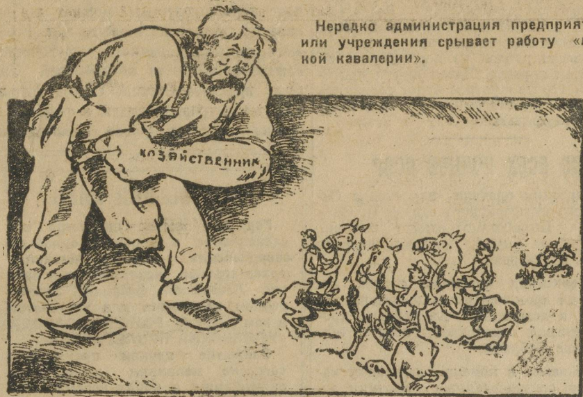
Нередко администрация предприятия или учреждения срывает работу «легкой кавалерии».