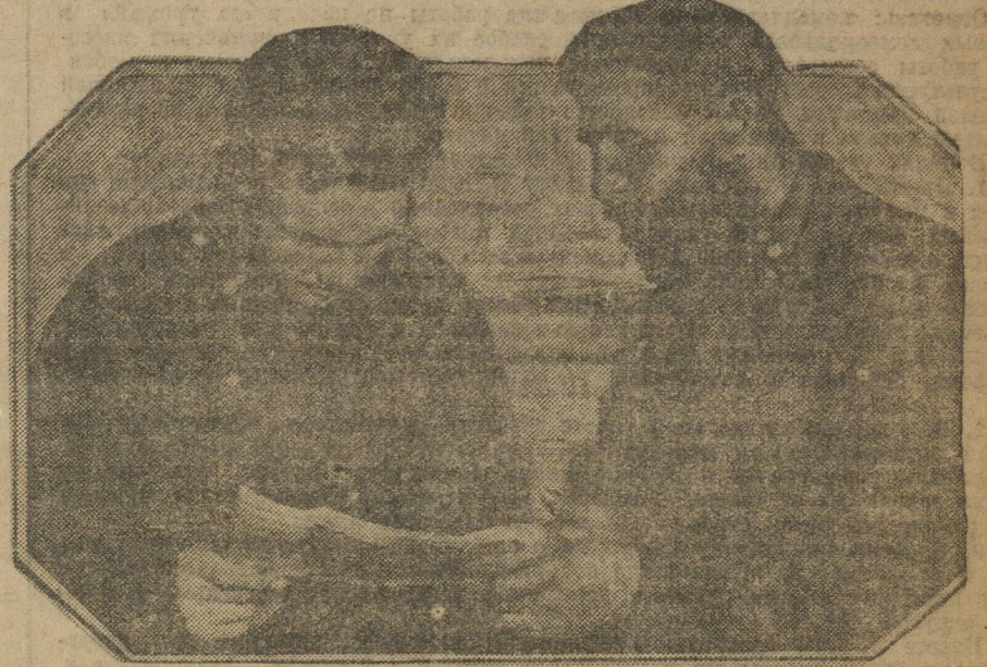
Делегаты Облпартконференции: слева — Д. Д. Д. (Татил); справа — С. С. С. (Тобольский округ).