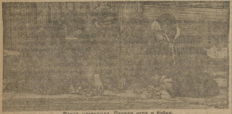
Весна наступила. Первая игра в бабки.