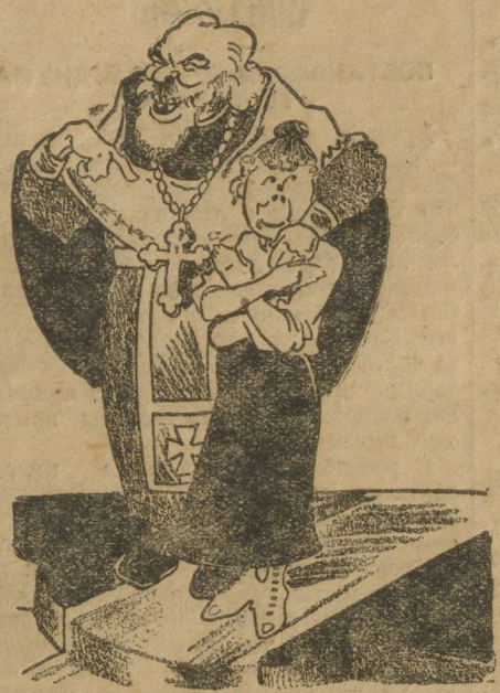
«Братья!... наши дети в верных руках».

Октябрьские торжества преподавательский состав школы решил отпраздновать «по-настоящему», по-старинке, уважая с уважением «рождения Христова». Накануне празднования силами комсомода был проведен среди родителей школьников денежный сбор. Собранные деньги употреблены на организацию школьной елки. Благочестивым родителям сначала не понравилось только то обстоятельство, — затем средства собирают на ок-