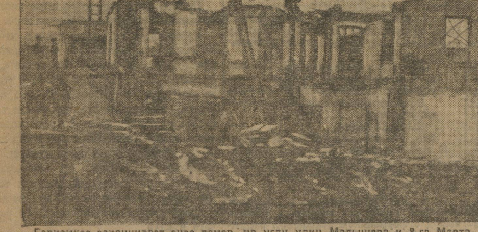
Горкомхоз заканчивает снос домов на углу улиц Малышева и 8-го Марта, где с начала лета начнется постройка 4-этажного Дома Контор. В первом этаже Дома Контор будут расположены магазины, во втором Коммунальный банк и в остальных двух этажах — учреждения. Дворостройка части Дома Контор будет закончена еще в начале 1930 г.