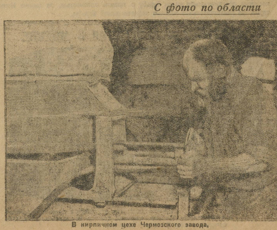
С фото по области В кирпичном цехе Чермошного завода.

Томского окрпрофбюро решило с 10 апреля по 10 мая провести общегородской конкурс на лучший клуб по производственному воспитанию масс. Конкурсом предусматривается культурный окрпрофбюро.