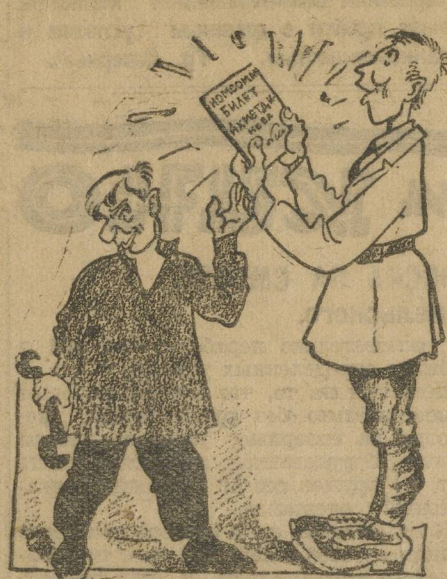
Секретное средство от производственного хулиганства.