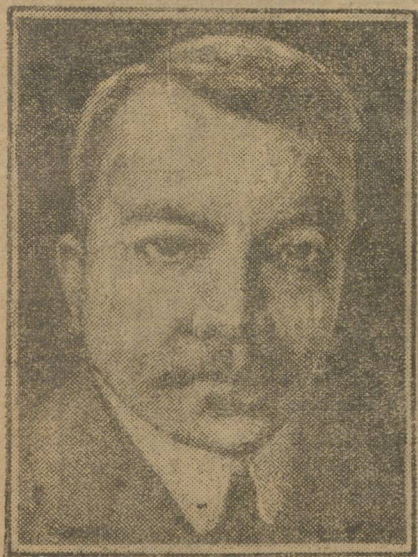
Кантонский диктатор и лидер гуансийской группировки Лю Ти-син, назначенный Чан Кай-ши.

В целом ряде мест соревнования, организованные комсомолом, вовлекают массы взрослых рабочих. Многие партийные организации (Москва, Украина) поставили уже вопрос о том, чтобы это соревнование сделать общим рабочим делом и сосредоточить руководство им в руках парторганизаций. Мы настоятельно выдвигаем перед Обкомом партии и Уралпрофсоветом вопрос о разработке таких же мероприятий по Уралу. Это даст возможность объединить усилия всех организаций вокруг боевых хозяйственных задач, стоящих перед нами, это обеспечит нам наибольший хозяйственный эффект.