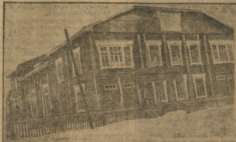
Новый железнодорожный клуб № 2 ст. Усольская (Пермский жел. дор.).