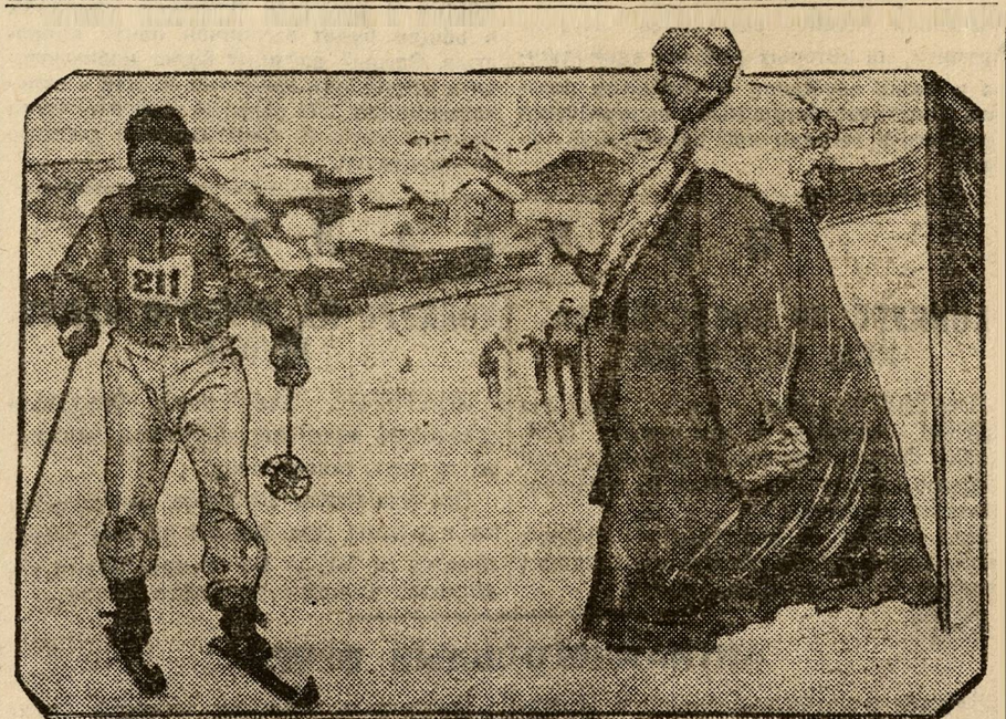
На дорожных соревнованиях. Лыжные забеги на 15 километров. У контрольного пункта.

Так как окончательный пуск станции на 3 тысячи номеров установлен 1-го июня этого года, округу связи предложено заключить теперь же договора на дальнейшее расширение станции до 5 тысяч номеров, которое должно быть закончено к 1 января 1931 года.