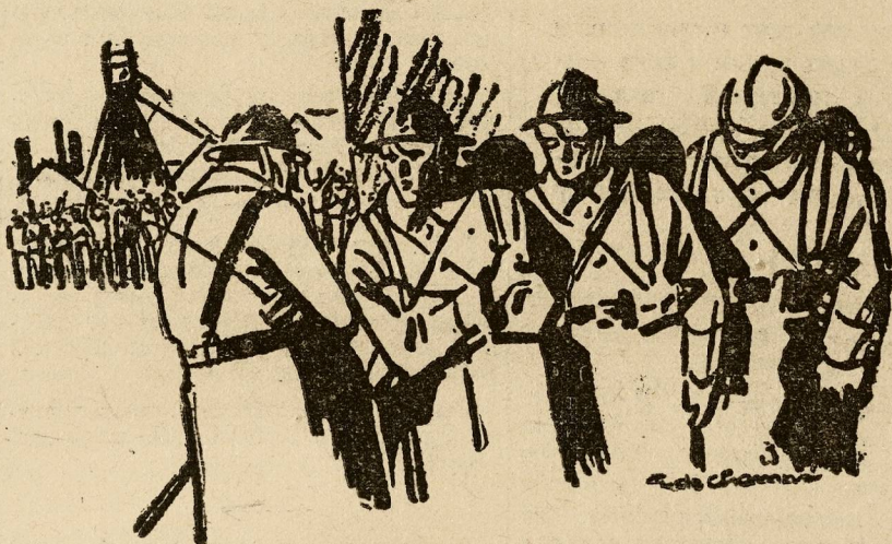
Рисунок, помещенный в «Юманите» от 14 января по случаю братания французских солдат с бастующими горняками. За этот рисунок автор его и редакция газеты привлечены к судебной ответственности.

НЬЮ-ЙОРК. В Боготе (Колумбия) совершено покушение на президента Венесуэлы — Гомеса. Покушение закончилось безрезультатно. Газета «Ассошиейтед Пресс» сообщает, что из Колумбии в Венесуэлу перешел повстанческий отряд в 500 чел. во главе с генералом Ареvalo-Чедено. Личный представитель Ареvalo-Чедено в Нью-Йорке Спиннетти опубликовал декларацию повстанцев Венесуэлы, призывающую к свержению Гомеса. В декларации говорится, что Ареvalo-Чедено стремится образовать конституционное правительство.