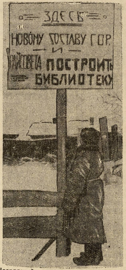
«Наглядный» наказ школьников и пионеров ВЛЗ'а.

Но, в общем, перевыборные собрания среди неорганизованных прошли более активно, чем отчетные.