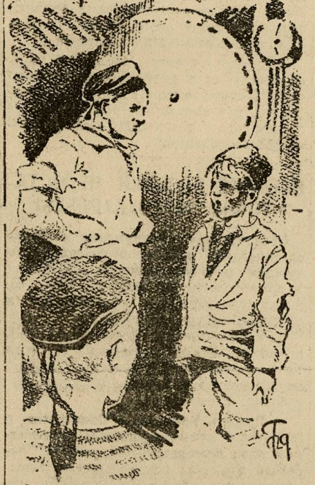
... Обступила вахта мальчишку...

Короткий поворот маховика — пар пошел в турбины. Грузно дышит машина. За вдохами насоса, за урчанием циркуляшки, за шумом вентилятора — головов не слышно. Где-то капает вода, прорывается пар, парит слегка у салыков, и визжащие, и скрипящие звуки сливаются воедино. Опять ударил звук