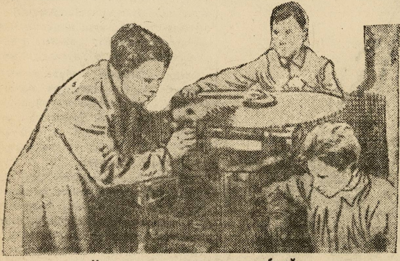
Надеждинские ударники за работой.

Одни одобрили молодежную инициативу, другие иронически встречали «ударные затеи», третьи держали политику нейтрального равнодушия.