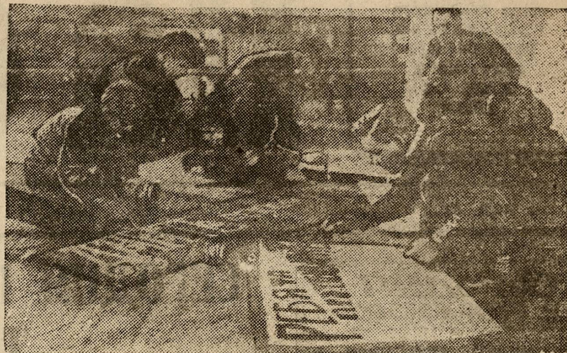
Учащиеся школы-семилетки им. Горькова пишут лозунги к общегородской демонстрации.