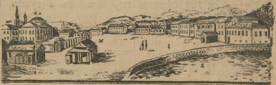
ВИД ПЛОЩАДИ ЗЛАТОУСТА.

оцепившим площадь. Раздался залп, затем еще и еще раз. Народ повалился. В результате: 28 убитых, 17 ч. умерших от ран. 41 ч. тяжело раненых, 19 чел. легко раненых и 28 получивших незначительные повреждения. Итого 128 человек. Конечно, фактически количество раненых было гораздо больше так как многие предпочитали лечиться на дому.