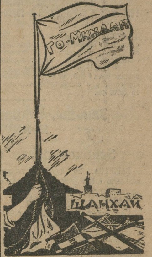
Шанхай не международный Шанхай—китайский!