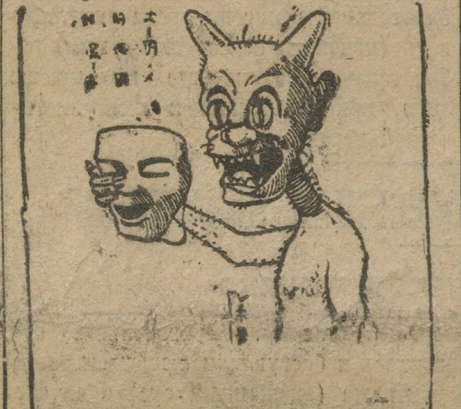
АГИТАЦИОННЫЙ ПЛАКАТ КИТАЙСКОГО БОМСОМОЛА.

Прежние китайские власти Шанхая отправили в Пекин официальные прошения об отставке. Регуляр-