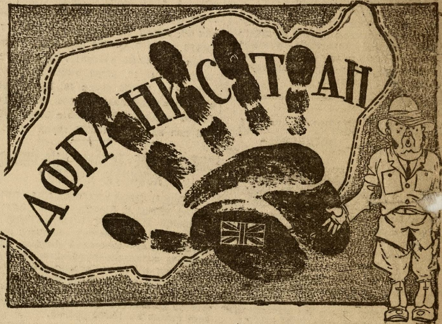
АНГЛИЙСКИЙ ДИПЛОМАТ: Где же тут нога?