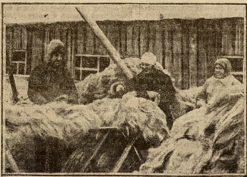
На заготовительном пункте Лыгосторга. Сдают лен.

Слабый подвоз грозит невыполнением месячного плана. Необходимо усилить работу хлебозаготовительных организаций, особенно в Пермском, Челябинском и Шадринском округах.